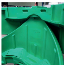
Empilement des musoirs