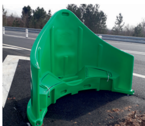
Trappes fermées (modèle 2 m)