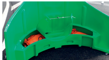
Trappes ouvertes (modèle 2 m)