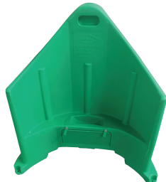
Trappe fermée (modèle 1 m)