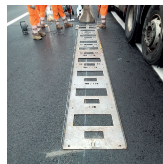
Gabarit de perçage